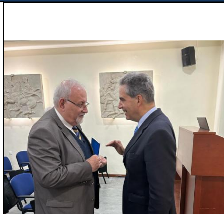
Αίθουσα Ρήγα Φεραίου

Επισημαίνεται ότι έχει υπογραφεί Σύμφωνο Αδελφοποίησης ανάμεσα στο Τάγμα του Αγίου Γαβριήλ και την Μ.Ε.τ.Ε. ως επισφράγιση της συνεργασίας τους προς τους κοινούς κοινωνικούς και κοινωφελείς σκοπούς που συνδέουν την πορεία και το έργο των δύο φορέων.