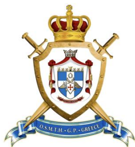
ΕΜΒΛΗΜΑ ΗΓΕΣΙΑΣ ΥΠΙΑΤΟΥ ΣΥΜΒΟΥΛΙΟΥ Μ.Ε.τ.Ε.