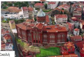
Μεγαλη του Γενους Σχολή

11:00: Οικουμενικό Πατριαρχείο Κωνσταντινουπόλεως Συνάντηση με τον Παναγιώτατο Οικουμενικό Πατριάρχη κ.κ. Βαρθολομαίο.