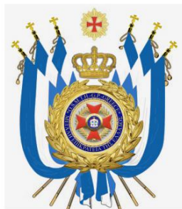
ΕΜΒΛΗΜΑ ΑΝΑΠΑΗΡΩΤΗ Μ.Ε.Α.