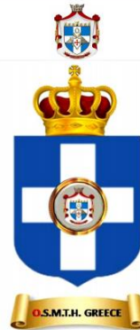
ΞΕΝΟΓΛΩΣΣΟ ΕΜΒΛΗΜΑ ΤΗΣ Μ.Ε.τ.Ε.