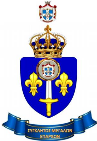
ΕΜΒΛΗΜΑ ΤΗΣ ΣΥΓΚΛΗΤΟΥ ΤΩΝ ΜΕΓΑΛΩΝ ΕΠΑΡΧΩΝ ΤΗΣ Μ.Ε.τ.Ε.