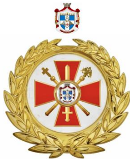
ΕΜΒΛΗΜΑ ΕΠΙ ΤΙΜΗ ΜΕΓΑΛΩΝ ΕΘΝΙΚΩΝ ΔΙΟΙΚΗΤΩΝ