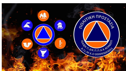
ΤΟ ΣΗΜΑ ΤΟΥ Ι.Δ.Α.Φ.Κ.

Πηγές: Συνέντευξη Ξ.Γ. στο Evima, Αρθρογραφία του Αδελφού Ιππ. Κρ.Τσακιτζιάν Διοικητού Αθηνών και Δημοσιογράφου, στην ηλεκτρονική στήλη politispress. Για τις Δράσεις του ΙΔΑΦΚ, μπορείτε να ενημερωθείτε επίσης στα Blog του. Αξιοσημείωτο ότι περισσότερη αρθρογραφία υπάρχει εκ μέρους των Επίσημων Δομών και Φορέων που έχουν ωφεληθεί από το έργο του Ινστιτούτου, όπως οι επίσημες ιστοσελίδες Σχολείων, Σχολών, αλλά και των Ενόπλων δυνάμεων και Σωμάτων Ασφαλείας.