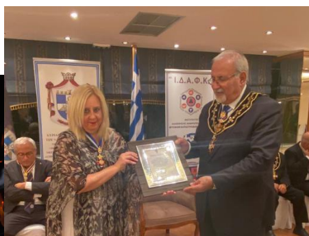
ΑΠΟ ΤΗΝ ΤΕΛΕΤΗ ΑΔΕΛΦΟΠΟΙΗΣΗΣ