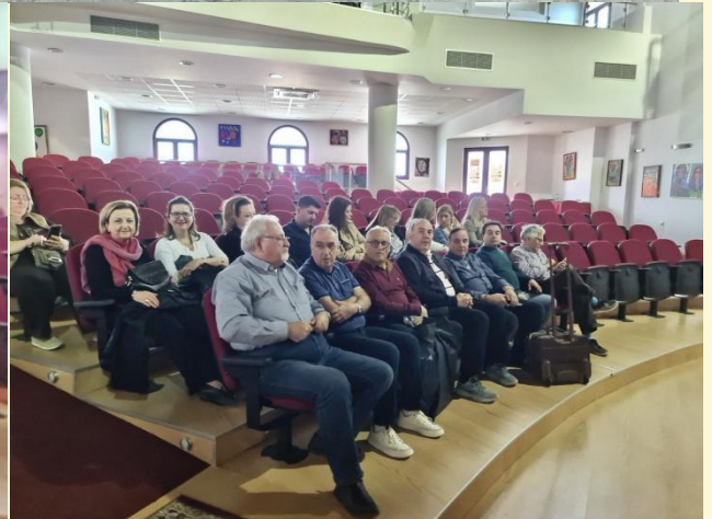
Ο Ηγούμενος της Ιεράς Μονής Αγάθωνος