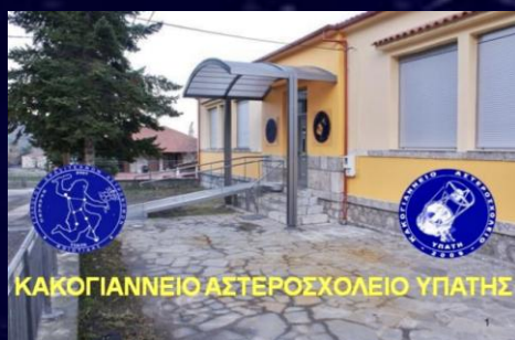
ΚΑΚΟΓΙΑΝΝΕΙΟ ΑΣΤΕΡΟΣΧΟΛΕΙΟ ΥΠΑΤΗΣ